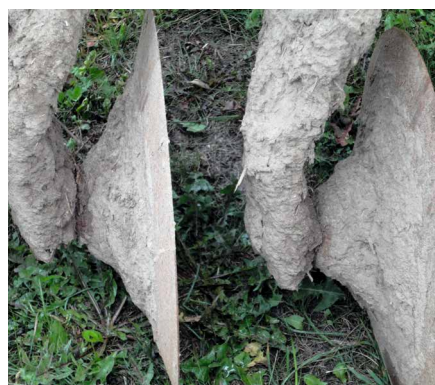
Image typique d'un déchaumeur à disques compacts recouvert de boue après l'épandage de lisier