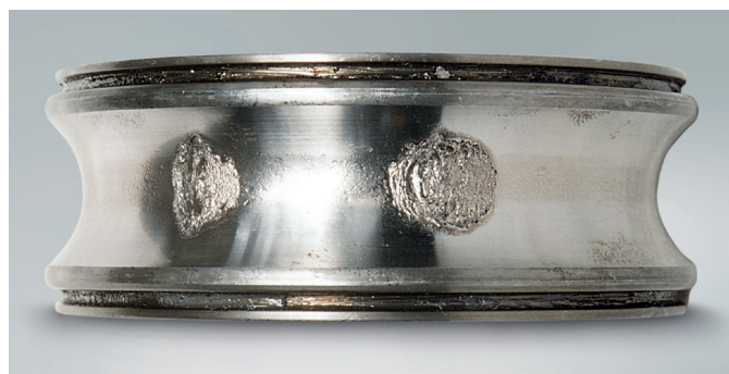
Signes de fatigue typiques : apparition de petites écailles plates se détachant de la surface du matériau du roulement (phénomène d'écaillage).

La capacité de charge dynamique (capacité de charge de base) est définie comme la charge constante appliquée aux roulements dotés de bagues extérieures stationnaires que les bagues intérieures peuvent supporter au cours d'une durée de vie d'un million de rotations ( 10^6 tours). La capacité