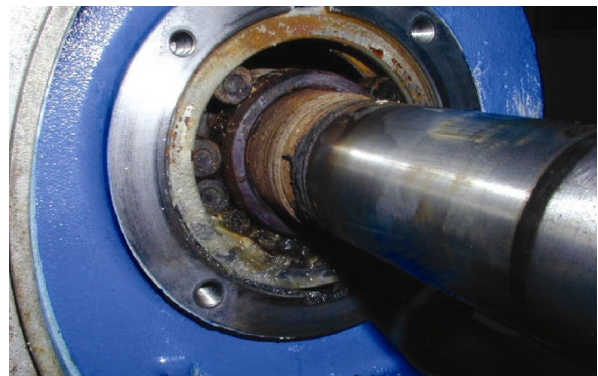
↑ Pompe Centrifuge secteur Pétrochimique