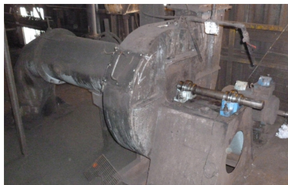
↑ Ventola per aspirazione delle polveri