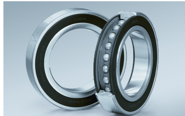
↑ Cuscinetti a sfere a contatto obliquo in versione schermata