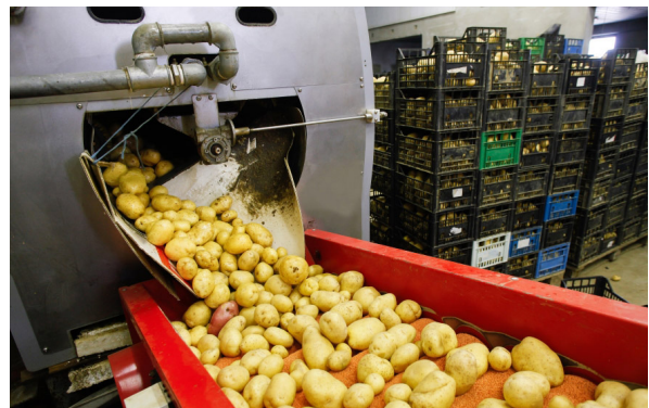
↑ Lavatrice a Tamburo