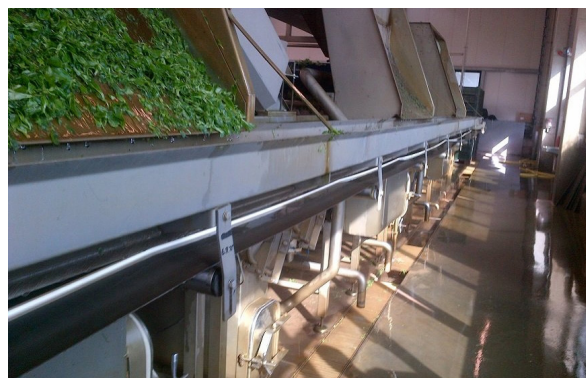
↑ Nastro Trasportatore